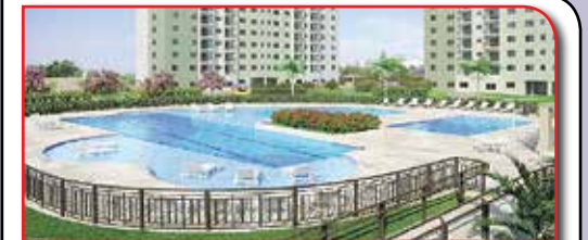
REF. 753821 - JD ORIENTAL OSASCO - R$ 317.000,00

Financia -Apartamento Novo No 14º Andar Do Innova Blue (São Francisco). Unidade Já Entregue. Excelente Localização. 03 Dormitórios Sendo 01 Suite, Sala Ampla Com Sacada, Cozinha Americana E Lavado. Excelente Condomínio Com Lazer Completo.