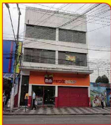
REF. 436721 CENTRO-OSASCO R$3.600.000,00

ÓTIMO PARA INVESTIDOR !!!! SÃO 3 PAVIMENTOS (TÉRREO / 1º E 2º ANDAR). TERRENO: 312 M2 - CONSTRUÇÃO: 810 M2 (SENDO 270 M2 CADA PAVIMENTO). COM EXCLUSIVIDADE !