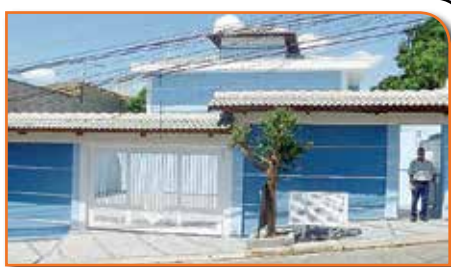
REF. 480521 – JARDIM ESTER OSASCO – R$ 360.000,00

ÓTIMA LOCALIZAÇÃO*OK P/ FINANCIAMENTO 2 Suites em piso frio, s/1 com sacada, Sala piso porcelanato, Cozinha piso porcelanato e azt, Lavabo piso frio e azt, Lavanderia piso frio e azt, Quintal piso frio, 1 Vaga de garagem