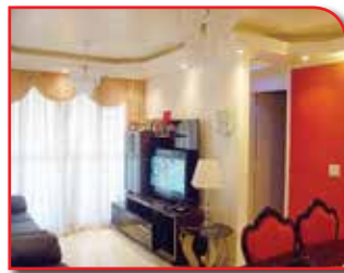
REF. 695711 - JD SINDONA OSASCO - R$ 250.000,00

* Financia *Oportunidade !! Vago - Apartamento De 03 Dormitórios, Sendo 01 Suite, Sala Para 02 Ambientes, Varanda, Cozinha, Lavanderia E Banheiro Social Com Box De Vidro. 01 Vaga De Garagem.