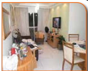
REF. 904421 - VILA YARA OSASCO - R$ 320.000,00

Financia -Apartamento Novo No 14º Andar Do Innova Blue (São Francisco). Unidade Já Entregue. Excelente Localização. 03 Dormitórios Sendo 01 Suite, Sala Ampla Com Sacada, Cozinha Americana E Lavado. Excelente Condomínio Com Lazer Completo.