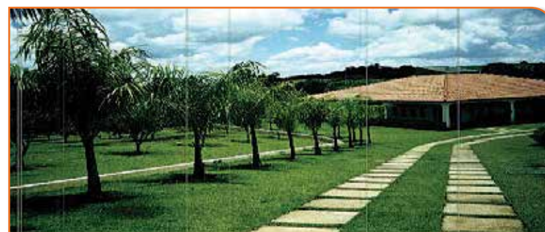
REF. 446621 - JUNDIAQUARA – ARAÇOIABA DA SERRA

R$ 1.400.000,00 Maravilhoso - Sítio !! 24.200,00 M2.Rodovia Castelo Branco ( 110 Km De São Paulo ) Próximo Ao Clube De Campo Pró Vida - Araçoiaba Da Serra - Jundiaquara. Imóvel Rico Em Detalhes Conforme Segue:casa Sede De 400,00 M2, Sendo:04 Dormitórios, Todos Suites, Sala 02 Ambientes, Rica Em Armários E Móveis Planejados, Alarme, Toda Avandada, Jardim De Inverno E Aquecimento Solar .Casa De Caseiro Com 86,00 M2.02 Lagos Com Peixes.pomar Com Aproximadamente 150 Árvores.8000,00 M2 De Gramado. depósito. Churrasqueira Coberta De 150,00 M2. Caixa Da Agua De 12.000 Litros. Canil. galinheiro. Portão Eletrônico Fundo Com Rio Toda Cercada Em Muro E Alambrado