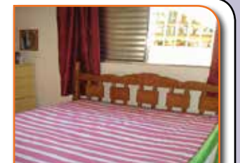
REF. 980411 - JARDIM VELOSO - OSASCO - R$ 350.000,00

Ótimo Para Financiamento! 3 Dorms Sd 1 Suites C/ Piso Frio, Coz, Wc E Lavanderia C/ Azt E Piso Frio, Gar P/ 2 Carros, Quintal C/ Churrasq.