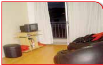
REF. 439721 VILA YARA - OSASCO R$ 290.000,00

Excelente Oportunidade Na Região Do Butantã!!! Cond. Ilhas Canarias, Imóvel Novo Com 3 Dorm, 1 Banheiro E Uma Vaga Demarcada. Lazer Completo!! Possui Piso Laminado Carvalho, Box No Banheiro Cozinha E Lavanderia Com Armários Planejados. A Apenas 3Km Da Usp, Próximo Ao Centro Comercial Do Rio Pequeno Com Bancos, Correios, Supermercados E Diversos Serviços. Faça O Que Precisar A Pe!!! Fácil Acesso A Av. Escola Politécnica, Raposo Távares E Marginal Pinheiros