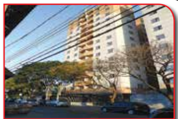
REF. 342521 - VILA QUITAUNA OSASCO - R$ 320.000,00

Bom P/ Financiamento -03 Dorm., C/ Armários Emb. Piso Cerâmica, Sala Ampla Com Sacada, Cozinha Com Azt, Lavanderia, Wc.