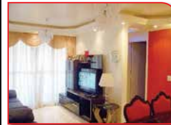
REF. 695711 - JARDIM SINDONA OSASCO - R$ 250.000,00

**Ótima Localização** Lindo**03 Dorm. Piso Cer., Sala Ampla Com Sanca, Cozinha c/Armários Embutidos, Wc. Condomínio c/ Piscina, Sauna, Salão De Jogos E Festa. Vaga Para 01 Auto / Financia.