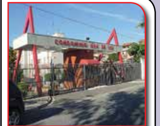
REF. 453821 - JD D'ABRIL OSASCO - R$ 255.000,00

**Ótima Localização** Lindo**03 Dorm. Piso Cer., Sala Ampla Com Sanca, Cozinha c/Armários Embutidos, Wc. Condomínio c/ Piscina, Sauna, Salão De Jogos E Festa. Vaga Para 01 Auto / Financia.