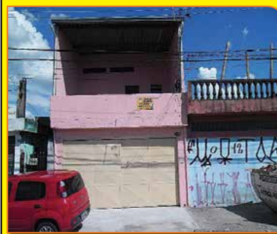
REF. 975521 – JARDIM BARONESA OSASCO – R$ 200.000,00

ATENÇÃO INVESTIDORES : 03 CASAS SENDO:01 DE 02 DORMITÓRIOS, SALA, COZINHA, BANHEIRO E LAVANDERIA.01 DE 01 DORMITÓRIO, SALA, COZINHA , BANHEIRO E LAVANDERIA.01 DE 01 DORMITÓRIO,COZINHA E BANHEIRO.LAJE SUPERIOR LIVRE PARA AMPLIAÇÃO / CONSTRUÇÃO DE MAIS UMA CASA.GARAGEM COBERTA PARA 02 CARROS.