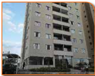
REF. 488621 - PIRATININGA OSASCO - R$ 248.000,00

* Financia *Oportunidade !! Vago - Apartamento De 03 Dormitórios, Sendo 01 Suite, Sala Para 02 Ambientes, Varanda, Cozinha, Lavanderia E Banheiro Social Com Box De Vidro. 01 Vaga De Garagem.